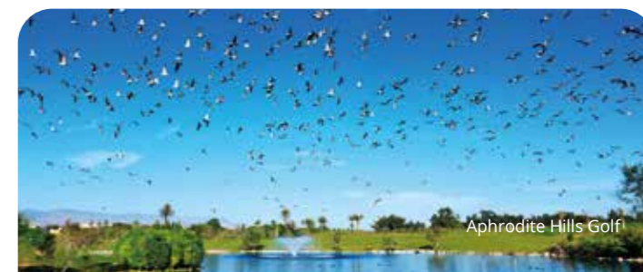
Aphrodite Hills Golf