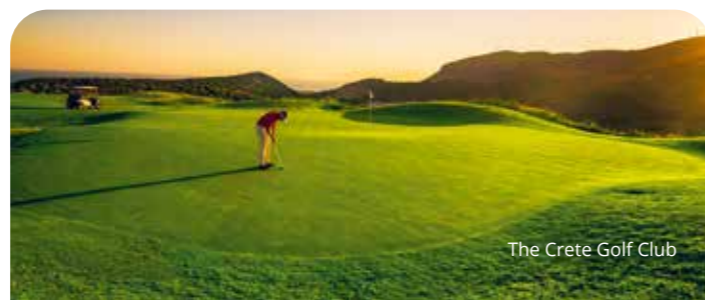
The Crete Golf Club

Exklusives Ambiente, luxuriöse Ausstattung und erstklassige Golfbedingungen – Das 4-Sterne Resort Aphrodite Hills liegt inmitten des gleichnamigen 18-Loch Championship Courses in den Hügeln über Paphos. Auf einer Höhe von 200 Metern bietet der Platz von nahezu allen Spielbahnen traumhafte Ausblicke auf das Meer. Eine Mischung aus modernem Design und traditionell zypriischem Dekor charakterisiert die großzügig gestalteten Zimmer. Der ausgezeichnete Spa-Bereich lädt zum Entspannen ein.