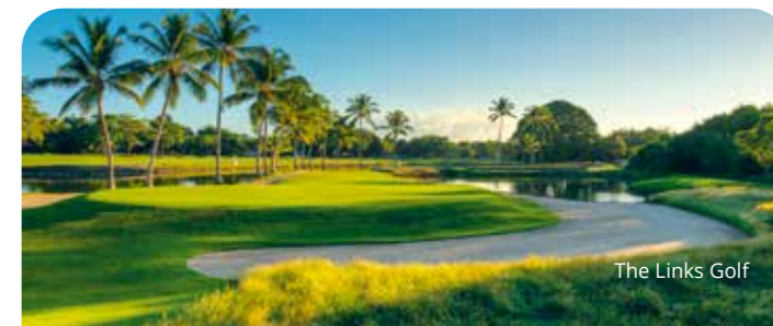
The Links Golf