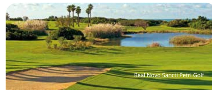
Real Novo Sancti Petri Golf