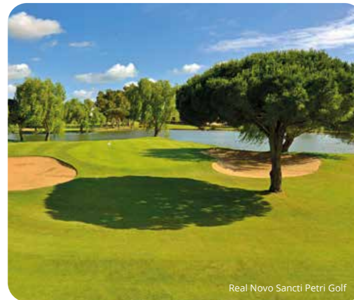
Real Novo Sancti Petri Golf