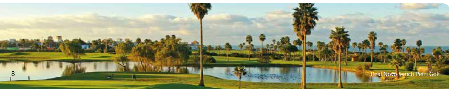
Real Novo Sancti Petri Golf