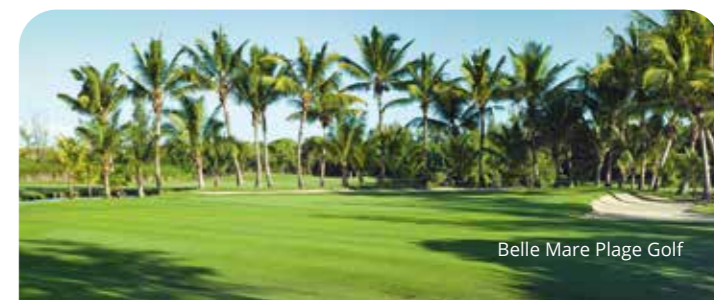
Belle Mare Plage Golf