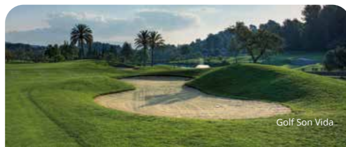
Golf Son Vida

Oberhalb einer Steilküste mit großartigem Panoramablick auf den Atlantischen Ozean und die Nachbarinsel Teneriffa – die Lage des Hotels Jardin Tecina ist einfach einmalig. Der herrlich angelegte 18-Loch Golfplatz Tecina ist ebenfalls spektakulär am Hang gelegen. Während der erste Abschlag am höchsten Punkt der Anlage liegt, werden bis zum 18. Loch Höhenunterschiede von rund 175 Metern zurückgelegt. Belohnung bietet ein phantastischer Blick auf das Meer von jedem einzelnen Loch.