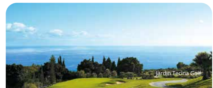
Jardin Tecina Golf