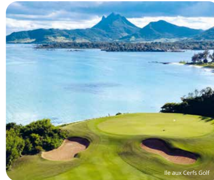
Ile aux Cerfs Golf