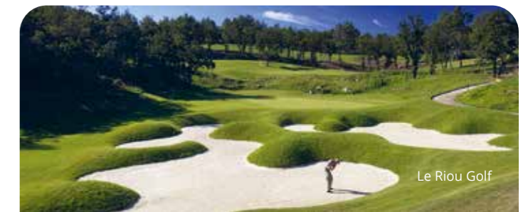
Le Riou Golf