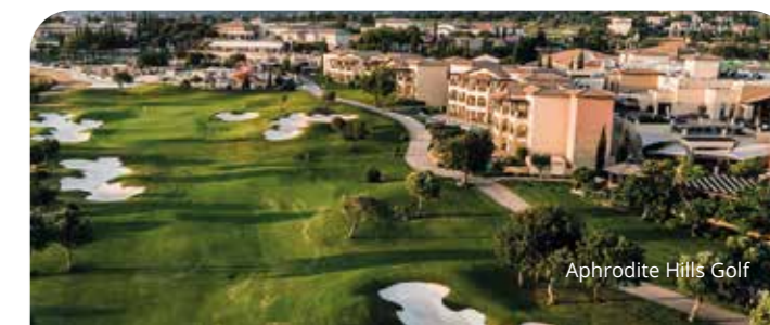
Aphrodite Hills Golf