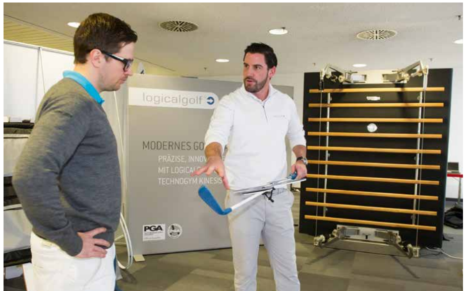
logicalgolf - hier mit einem Messestand im Rahmen der PGA Arbeitstagung zu sehen - ist Poolpartner der PGA of Germany und hat im Golfclub München Eichenried eine erfolgreiche Golfakademie mit acht voll ausgelasteten PGA Golfprofessionals installiert.

digen Gespräch. Dabei tauschen wir uns über Positives ebenso aus wie über Dinge, die es zu verbessern gilt. Es ist extrem wichtig, dass die Golfschule und jeder einzelne Professional die Ausrichtung und die Ziele des Golfclubs kennt und diese Ziele mitträgt. Gleichzeitig ist eine unbedingte Voraussetzung für den Erfolg, dass der Golfclub die Golfakademie bestmöglich unterstützt, sei es infrastrukturell oder bei Kommunikationsthemen. Es macht keinen Sinn, dass Club und Golfschule oder Professional immer nur ihr eigenes Ding machen. Den Pros muss bewusst sein, dass sie Club Professionals sind. Sie sind keine Einzelkämpfer, die eben auf irgendeiner Anlage arbeiten. Sie müssen sich voll mit dem Club identifizieren. Das gilt es gleich beim Einstellungsgespräch klar zu stellen. Und den Managern muss bewusst sein, dass der Pro ein ganz wichtiger Teil des Clubs ist. Der Pro soll seine Heimat im Club haben und sich dort heimisch fühlen. Dann führt der gemeinsame Weg zum Erfolg.