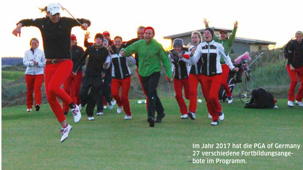
Im Jahr 2017 hat die PGA of Germany 27 verschiedene Fortbildungsangebote im Programm.

Lebenslanges Lernen ist für Fully Qualified PGA Golfprofessionals eine Grundvoraussetzung, um langfristig beruflich erfolgreich zu sein und dauerhaft den sich ständig verändernden Anforderungen des Marktes und der Kunden gerecht zu werden. Denn erfolgreich zu unterrichten, heißt auch immer, selbst beständig weiter auf hohem Niveau zu lernen und sich weiterzubilden. Es gilt, sich sowohl auf dem modernsten Stand des Wissens im Golfsport als auch der Unterrichtsmethodik und Lehrdidaktik zu halten. Seit 1998 organisiert die PGA of Germany ein umfangreiches Fortbildungsangebot, das es jedem engagierten PGA Professional erlaubt, sich und das eigene Wissen und Können stets auf der Höhe der Zeit zu halten.