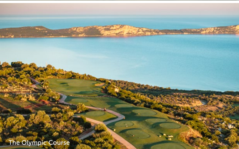
The Olympic Course

Schnell und schwierig ist der Dunes Course, der direkt am Hotel startet. Dort hat Bernhard Langer für Länge und schwierige Grüns gesorgt. Viele Greens sind leicht erhöht und praktisch alle mit Bunkern gut verteidigt. Besonders spektakulär ist die Bahn 2, wo man parallel zum Hotel Richtung Meer spielt.