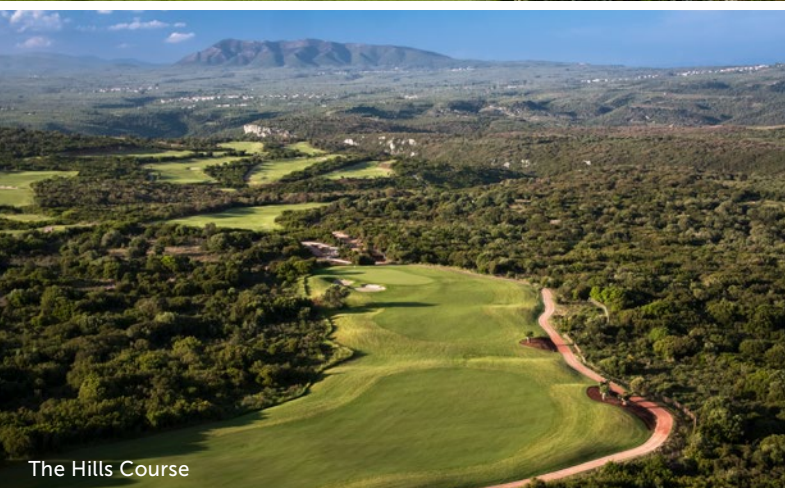
The Hills Course

Das Design des neuen Golfplatzes in Costa Navarino ist von José María Olazábal. Der Hills Course verläuft auf einem Plateau oberhalb des Bay Courses und hat daher ein etwas hügeliges Design. Die Bahnen sind von Bäumen umgeben und im Vergleich zu seinem Nachbar-Platz ist dieser etwas kürzer.