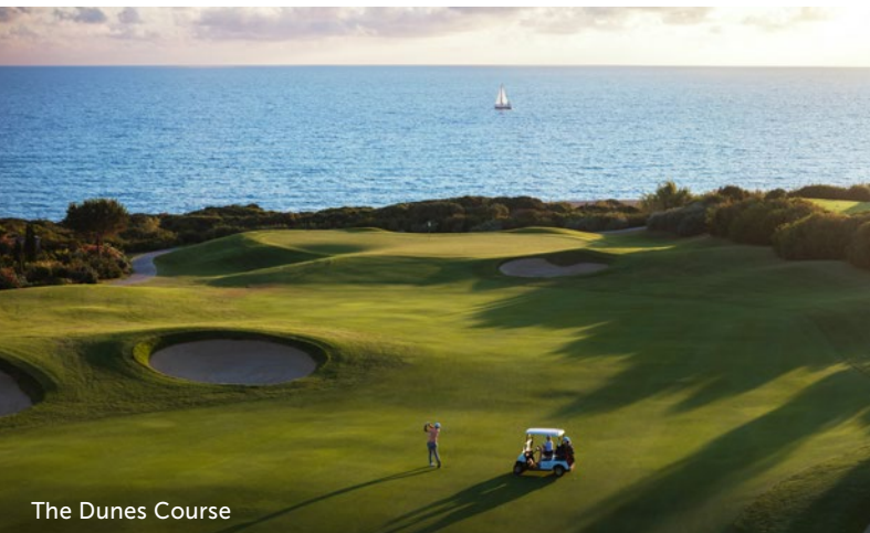
The Dunes Course