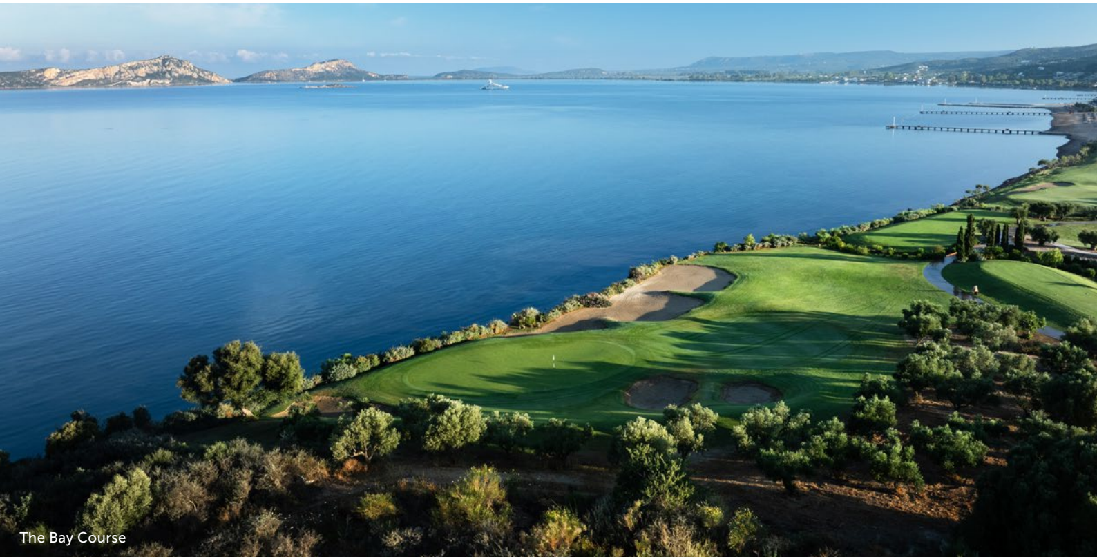
The Bay Course