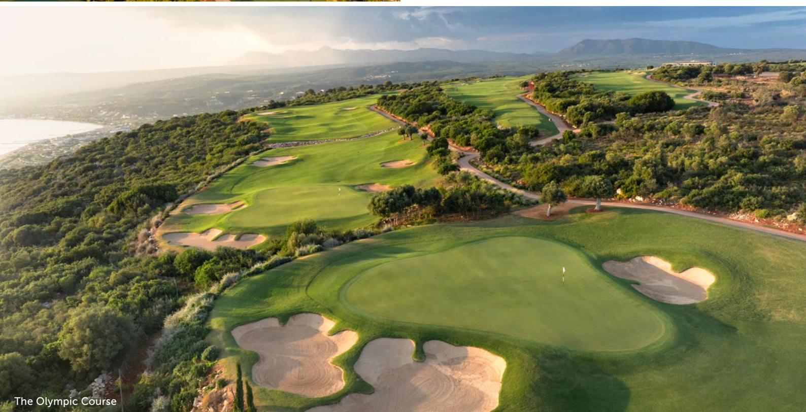
The Olympic Course

Der neue Golfplatz in Costa Navarino thront über der Küste des ionischen Meeres, mit einem atemberaubenden Panoramablick auf die historische Bucht von Navarino. Einige Löcher liegen direkt an den Klippen. Mit etwa 60 Bunkern ist dieser Platz eine Herausforderung für Golfer aller Spielstärken.